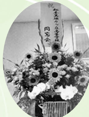
同窓会からの楽屋花