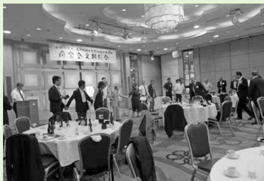
輪になって恒例の校歌斉唱