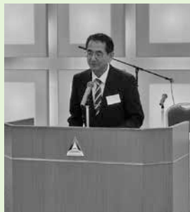
久保村学校長あいさつ