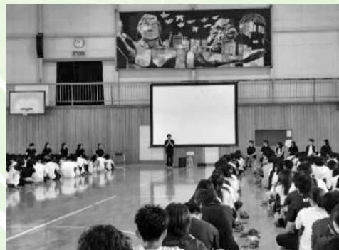
2学期始業式後の受賞報告集会