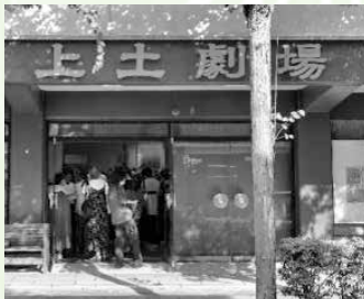
凱旋公演を同窓会も観劇応援