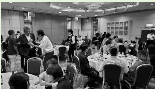
旧交を温めて盛り上がります!!