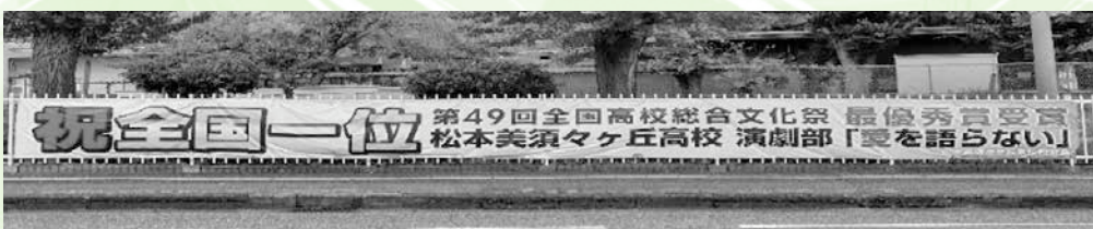
同窓会が作成した告知横断幕を公園前に掲出